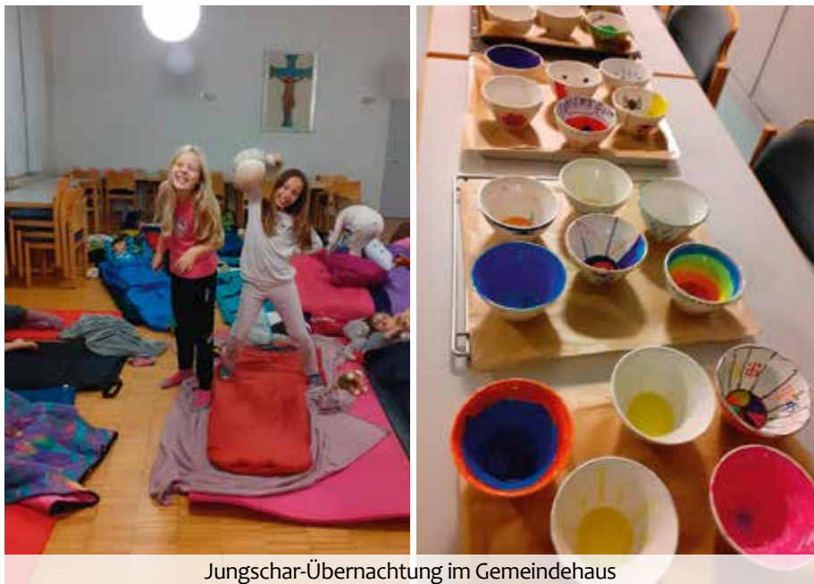
Jungchar-Übernachtung im Gemeindehaus