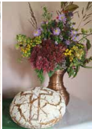
Erntedankfest St. Marien