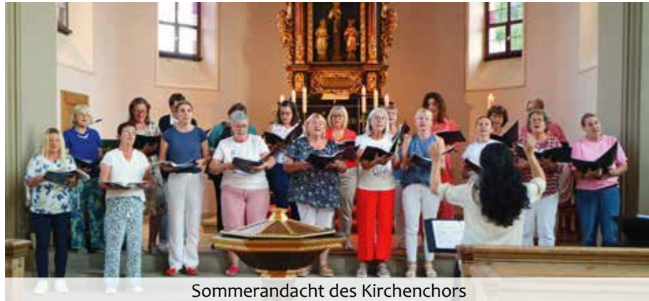
Sommerandacht des Kirchenchors