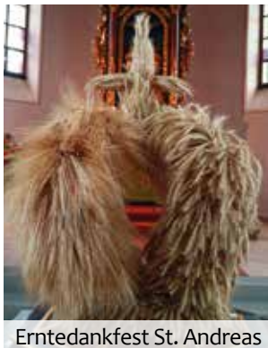
Erntedankfest St. Andreas