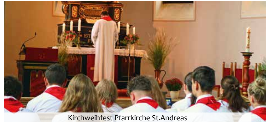
Kirchweihfest Pfarrkirche St.Andreas