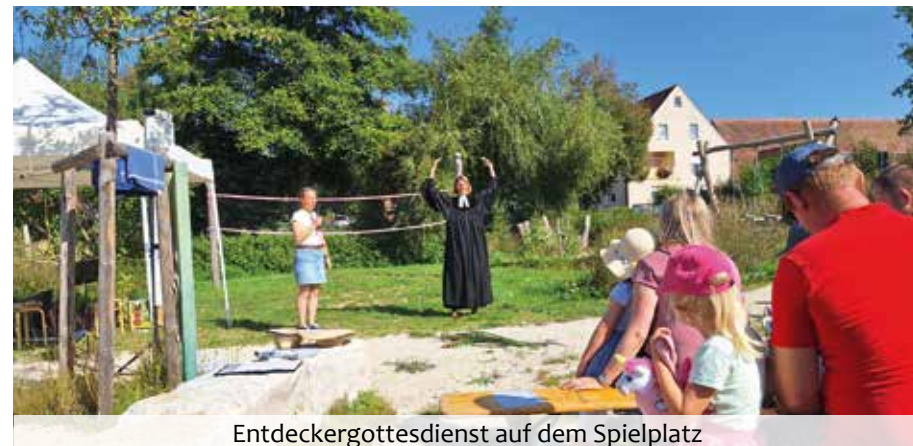
Entdeckergottesdienst auf dem Spielplatz