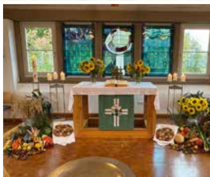
Erntedankaltar in Abenberg