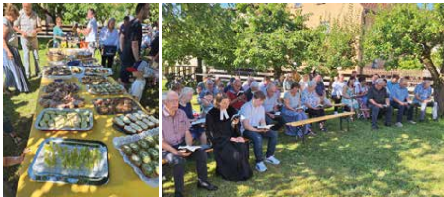
Kirchweihfest in Obersteinbach