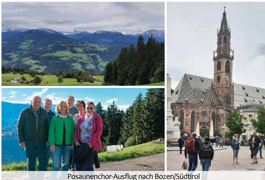
Posaunenchor-Ausflug nach Bozen/Südtirol