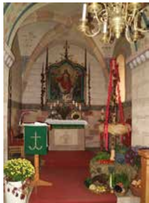
Erntedankfest St. Nikolaus