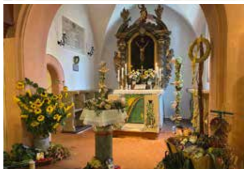
Erntedankaltar in Dürrenmungenau